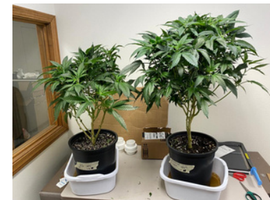
Ci-dessus, deux clones irrigués de la même plante :

À gauche, avec de l'eau ordinaire. À droite, avec de l'eau structurée TWS.